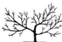
Sistema de condução em vaso