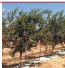
Sistema de condução com aramação