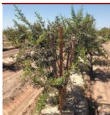
Romãzeira conduzida em multi-tronco

esqueleto da árvore, situando-se os 2 a 3 ramos entre cerca de 50 a 70 cm do solo. Estes ramos vão ser dispostos de forma perpendicular à linha sendo suportados pelo sistema de aramação, sendo possível um aumento da densidade de plantação neste sistema e, verificando-se uma entrada em produção mais rápida do que no sistema de condução em vaso. Este é um sistema mais correntemente usado em pomares intensivos, uma vez que, como referido anteriormente, permite melhorias em termos de qualidade dos frutos e produtividade.