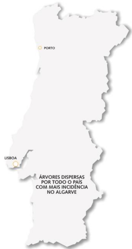
Distribuição de romãzeiras em Portugal

Em termos de morfologia é um arbusto que pode atingir mais de 7 m de altura em condições naturais, mas em condições de cultivo atinge cerca de 5 m. A grande maioria das variedades de romãs são decíduas, embora existam algumas variedades sempre verdes na Índia ou que, sendo decíduas, apresentam comportamento de sempre verdes.