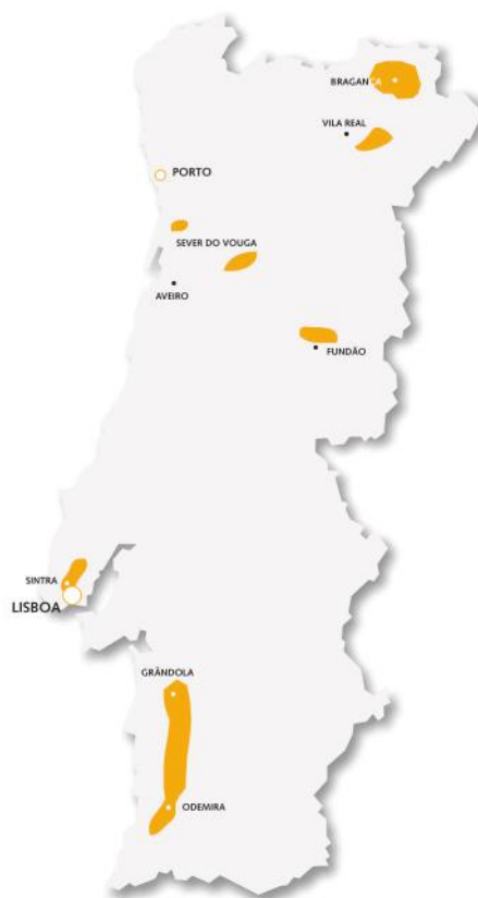
Distribuição de framboesas em Portugal

As framboesas comercialmente cultivadas atualmente derivam da framboesa vermelha europeia ( Rubus idaeus L.) e das framboesas Norte Americanas vermelha ( Rubus strigosus Michx.) e preta ( Rubus occidentalis L.). A enorme diversidade existente dentro do género Rubus , permitiu a obtenção de novas cultivares através de programas de melhoramento.